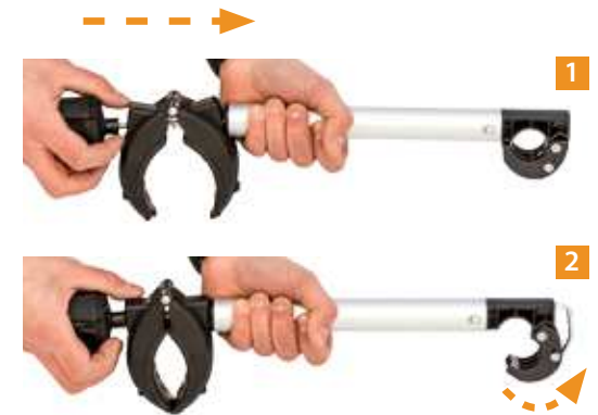
Braccio blocca telaio con sistema rimovibile. Removable bike's fixing arm.